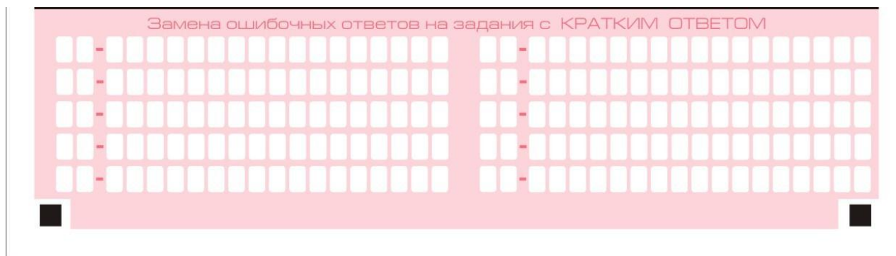
Рис. 8. Область замены ошибочных ответов на задания с кратким ответом

В нижней части бланка ответов № 1 предусмотрены поля для записи исправленных ответов на задания с кратким ответом взамен ошибочно записанных (рис. 8).